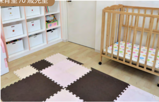
保育室 / 0歳児室