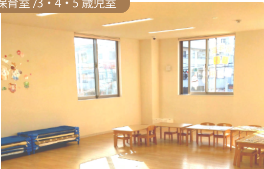
保育室 / 3・4・5歳児室