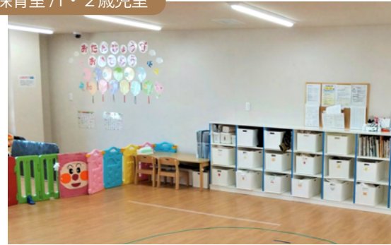
保育室 / 1・2歳児室